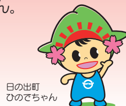
日の出町 ひのでちゃん

申込 企画財政課まで 7月24日(水) 締切 受付 は午前8時30分～午後5時15分(土日・祝日除く)