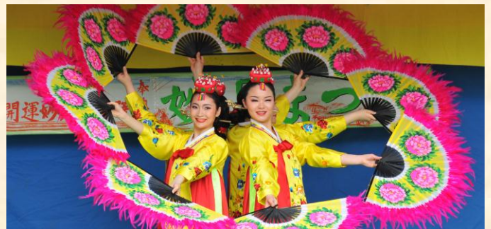
韓国伝統芸術団による舞踊「扇の舞」